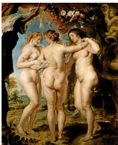
Peter Paul Rubens, Les Trois Grâces 1639 Huile sur bois / Oil on panel 181 x 221 cm (Museo del Prado, Madrid)