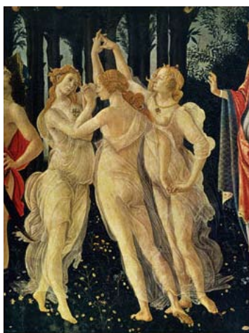
Sandro Botticelli, Le Printemps (Détail / Detail) 1478-1482 Tempera sur bois / Tempera on panel 203 x 314 cm (Uffizi, Florence)